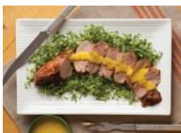
Lomo de cerdo (pernil) marinado al mojo