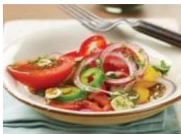
Ensalada de pimientos dulces, cebolla y tomate