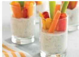
Vasos de dip de verduras