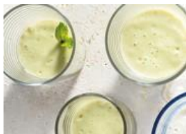
Batido de aguacate marroquí