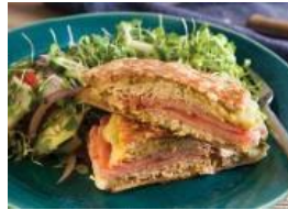
Sándwich cubano de Ronaldo