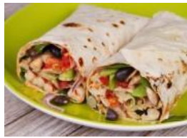
Burritos de pollo y frijoles negros