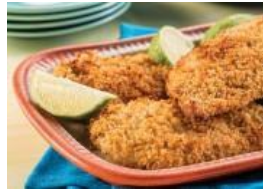
Pollo frito al horno al estilo latino