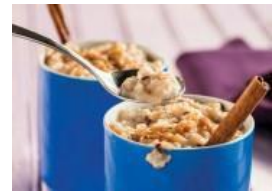
Arroz con leche