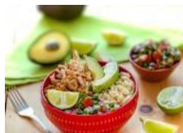
Tazón de arroz integral y frijoles pintos con pollo y pico de gallo