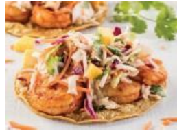
Tortillas de maíz con camarones ahumados, ensalada de mango y chipotle