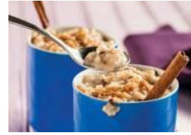
Arroz con leche