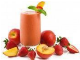
Batido de frutas y almendras