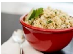
Quinua con lima y cilantro