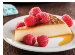
Flan de canela