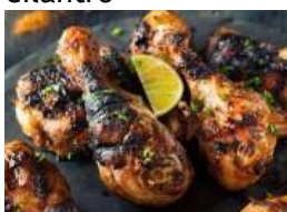
Pollo asado económico con lima y cilantro