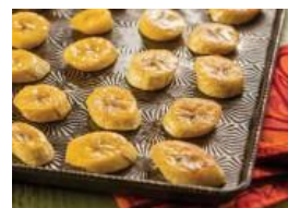
Maduros al horno