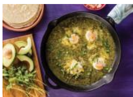
Huevos ahogados en salsa verde