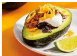
Aguacate relleno con cuatro capas