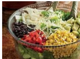
Ensalada mexicana picada con lima