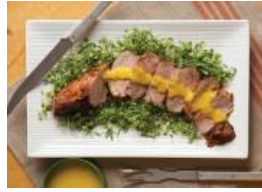
Lomo de cerdo (pernil) marinado al mojo