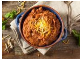
Frijoles refritos saludables