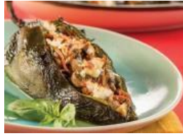
Poblanos rellenos de vegetales