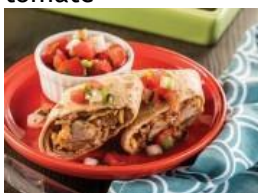
Chimichangas de carnitas horneadas al estilo de Ingrid Hoffmann