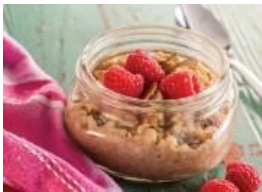
Cereal de avena y quinua