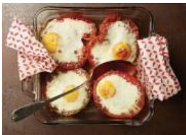
Huevos al horno dulces y ahumados