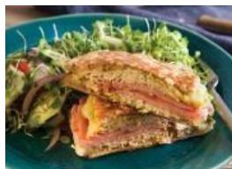
Sándwich cubano de Ronaldo