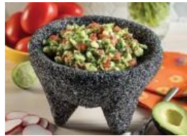
Guacamole de pepino