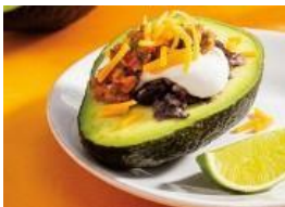
Aguacate relleno con cuatro capas