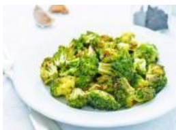
Brócolis asados a la cubana