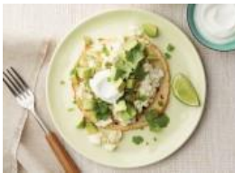
Huevos rancheros blancos