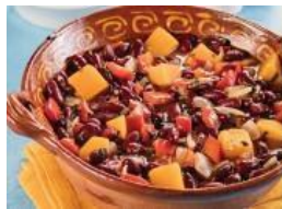
Estofado de frijoles rojos