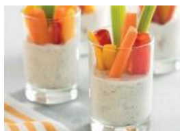
Vasos de dip de verduras