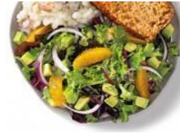
Ensalada verde con naranja, aguacate y cebolla