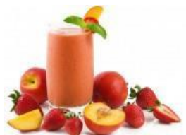
Batido de frutas y almendras