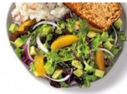
Ensalada verde con naranja, aguacate y cebolla